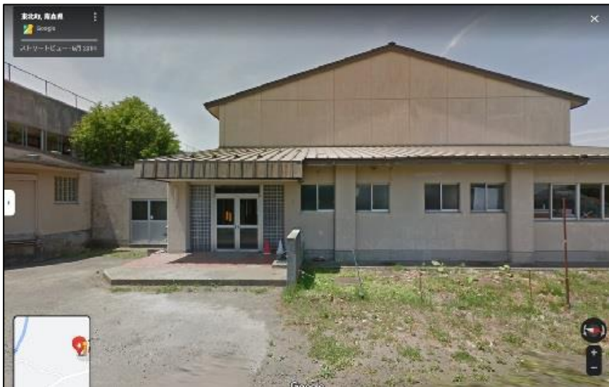
【体育館】（保管・作業場所）